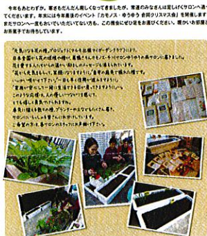
豊島区社会福祉協議会の サロン通信「笑顔」