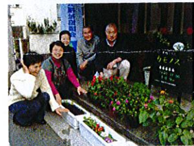
上「千川さろん ゆうゆう」 下「巢鴨さろん“カモノズ”」の皆さん